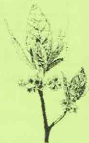
<葉と花が同時に開くクロモジ> 植物の特徴をしっかりとらえた 執筆者手書きのイラストつきです