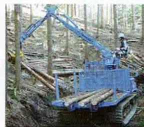
搬出路で 林業機械による 集材のようす