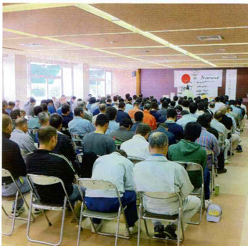
祈願祭／神事には188名の森林組合役職員一同が参加