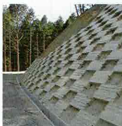
②法面工事後の保護に

使用する木材は組合の木材センターで購入し、加工場(本所、豊田支所、旭支所)で製作しています。間伐材の有効利用はもちろんですが、これからも組合員を含め多くの方々が身近な所で木を使い、木の良さを感じてもらえるよう、製作を進めていきますので、欲しい商品のリクエスト等がありましたら加工グループまでご連絡ください。