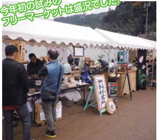
●フリーマーケット