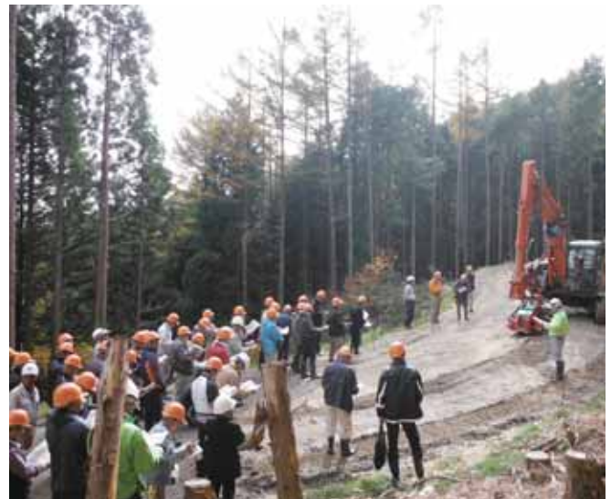
●高性能林業機械による現場施業の見学会