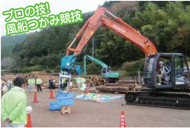
●高性能林業機械／実演