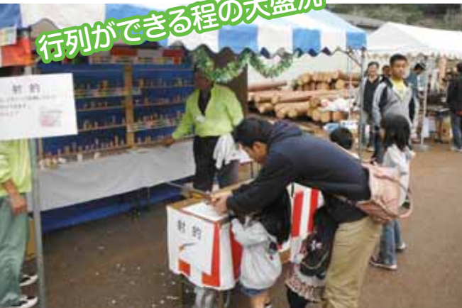
●今年は「射的」ブースを設置しました。