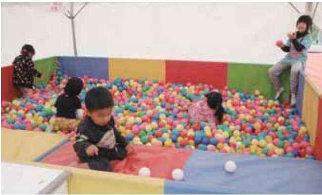
●ボールプールも大人気!!