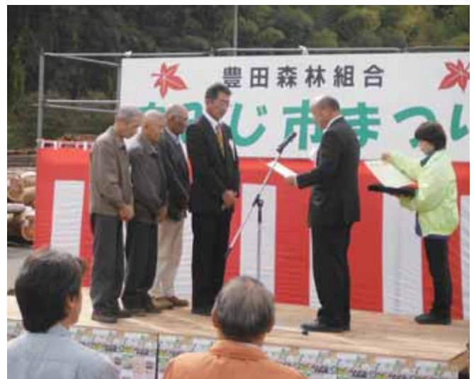
●優良材出品者 / 表彰式