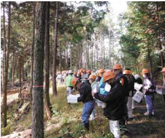
●森づくり団地の現場視察