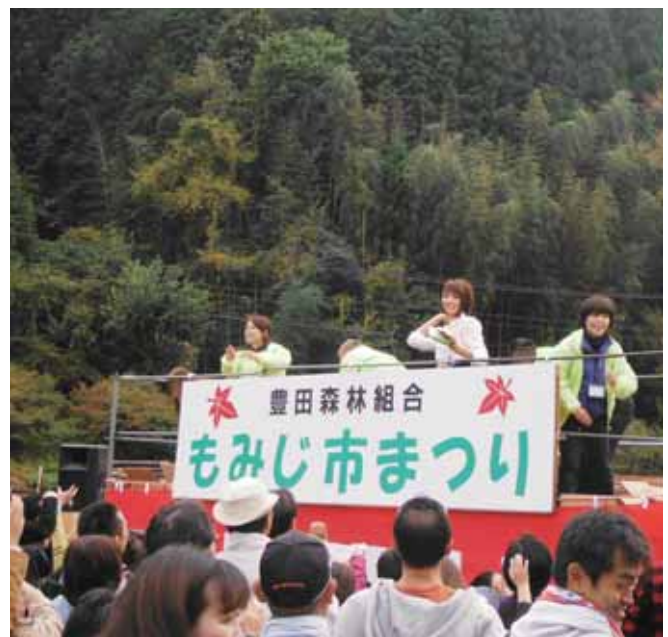
●フィナーレの餅投げ