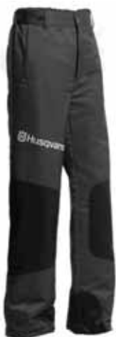
ハズクバーナ・ゼノア プロテクティブズボンクラシック ¥14,000(税別)