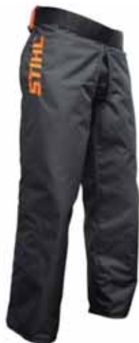
スチール チャップス(ジッパータイプ) ¥14,800(税別)