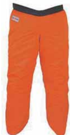
マックグリーン あかるーいチャップス ¥14,800(税別)

チェーンソーパンツは通常のズボンと同様に履けるタイプのもので、チャップスは前掛けのように。ズボンの上から、装着するタイプです。