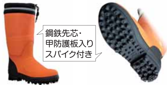
鋼鉄先芯・ 甲防護板入り スパイク付き