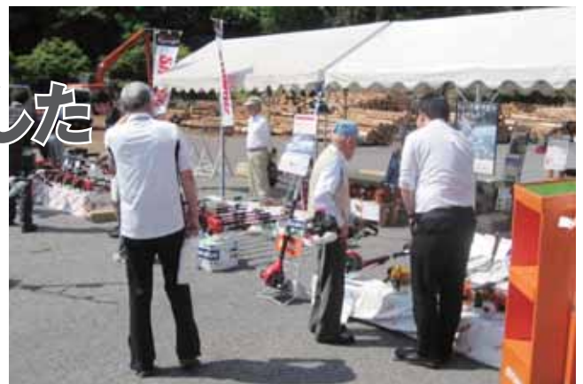
秋の林業機械展示即売会は 平成29年11月11・12日(土・日)で開催予定

平成29年6月10・11日(土・日)の両日、組合本所にて林業機械の展示即売会を開催しました。二日間でのべ350名の来場者があり、時季的に刈払機の引き合いが非常に多く、大盛況で終わることができました。また、先に開催した旭支所と稲武支所の展示会にも沢山の来場者があり、誌面ではありますが厚く御礼申し上げます。秋にも開催を予定しておりますので、宜しくお願いします。