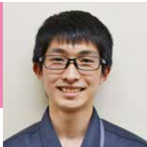
猿投農林高校卒 長野県林業大学校

まずは林業学校で知識と技術を身につけ、より早く仕事に慣れるように努めて参ります。よろしくお願ひします。