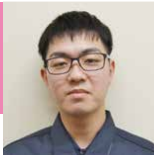
猿投農林高校卒 長野県林業大学校

4月から林業大学校に通っています。ここで知識や技術を蓄え、森林組合の職員という自覚をもって励みます。