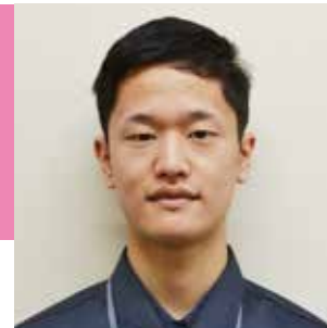
安城農林高校卒 岐阜県立森林文化アカデミー

今は何事も未熟で至らない事ばかりですが、アカデミーでの2年を通して組合の力になれるように頑張ります。