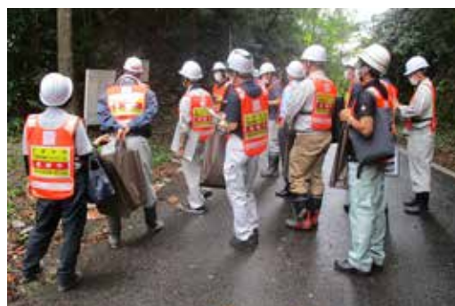
協議会のメンバーによるパトロール